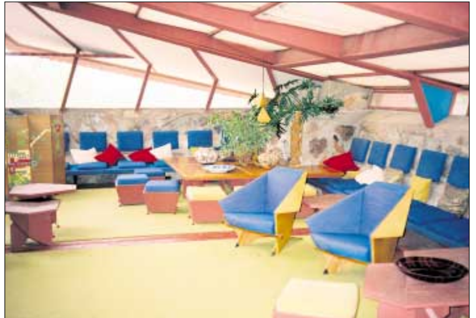
Olohuoneena käytetty puutarhahuone sisältää Frank Lloyd Wrightin suunnittelema huonekaluja. Katto on kangasta, joka läpäisee valoa.

Rakennuksia yhdistävät erilaiset terassit ja tasot.