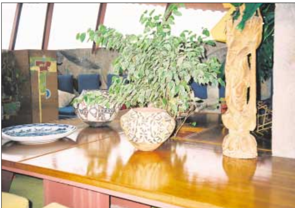
Wrightin "orgaaninen arkkitehtuuri" hyväksyi koriste-esineinä intiaanien keramiikkaa. Myös Japanin matkoilta tuotua taidetta on esillä.